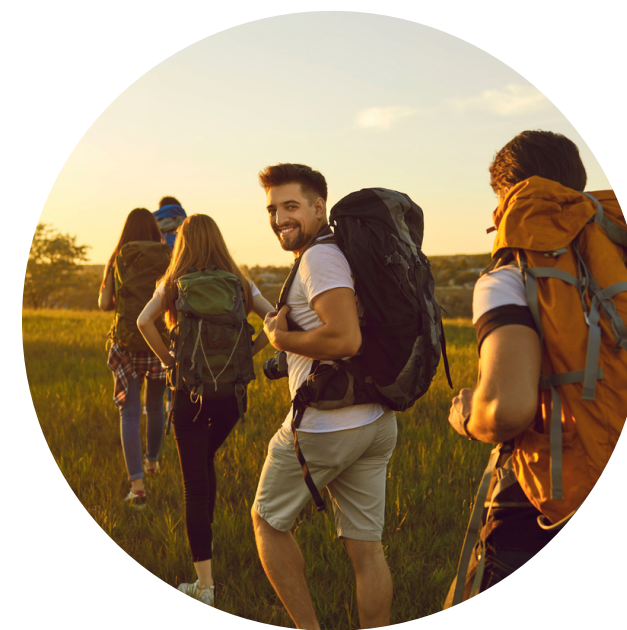
Turystyka i rekreacja