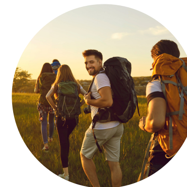
Turystyka i rekreacja