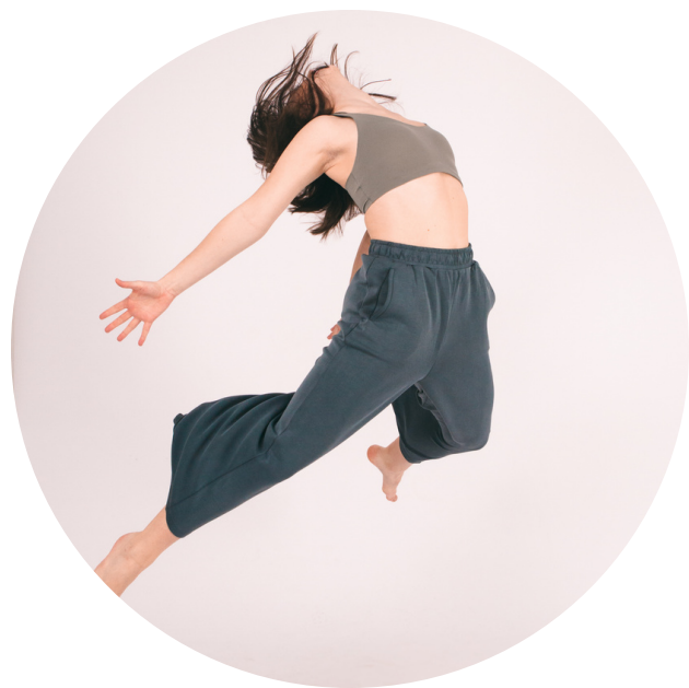
Tanec w kulturze fizycznej